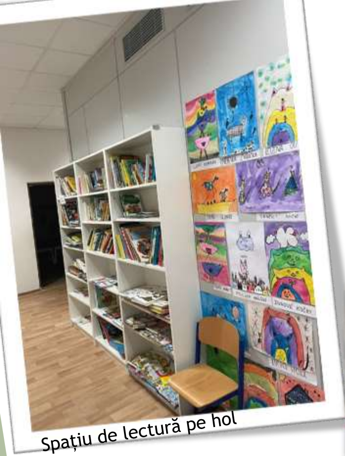
Spațiu de lectură pe hol