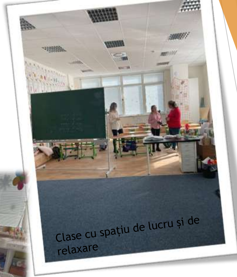
Clase cu spațiu de lucru și de relaxare